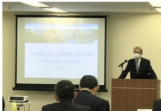
【滝沢教授の講演はオンラインで配信】