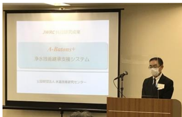
【JWRC 市川部長より A-Batons+ 浄水技術継承支援システムのご紹介】