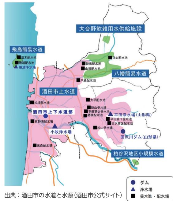
【酒田市水道事業給水区域図】