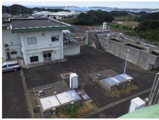
2. 門野田浄水場外観

上記主要施設6浄水場を含む150程度の場外施設 (水源、中継ポンプ所、配水池等)